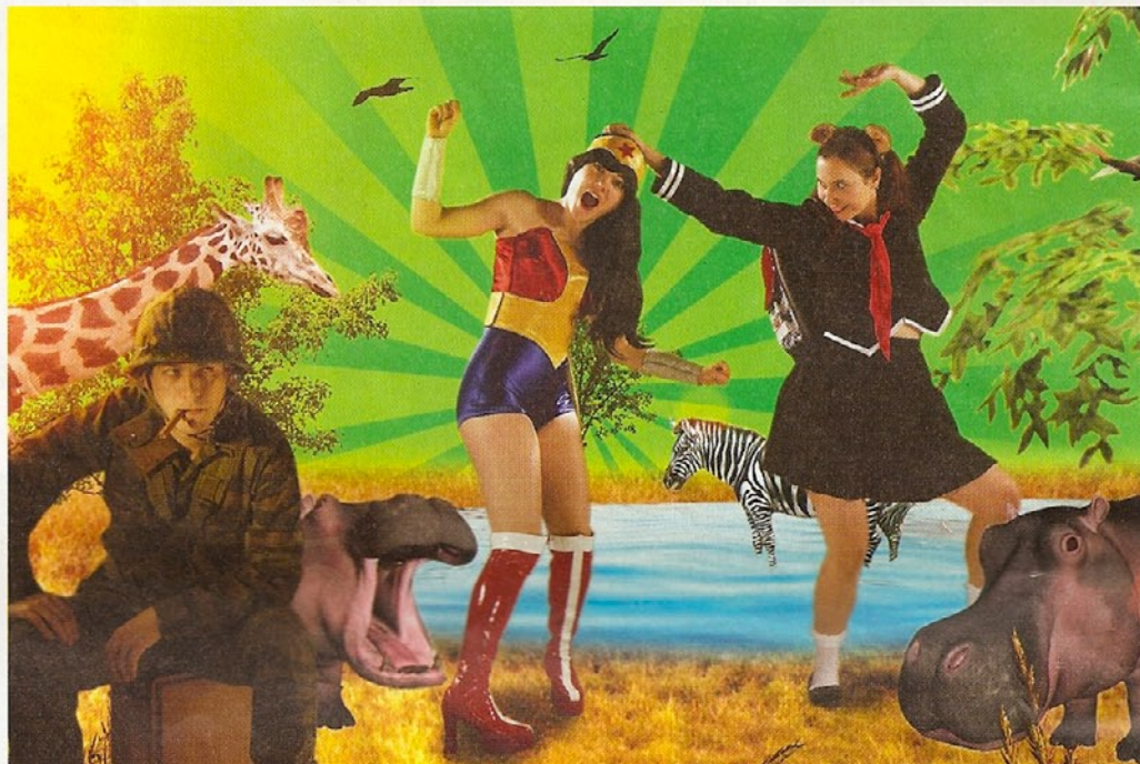
© DANILE BALMAT, BRIAN TORNAY, CHRISTIAN DENISART

Avec l'explosion des connexions internet apparaissent les «jeux massivement en ligne». Ils permettent