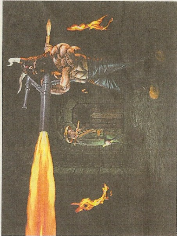
Un des visuels annonçant le spectacle Yoko-Ni.